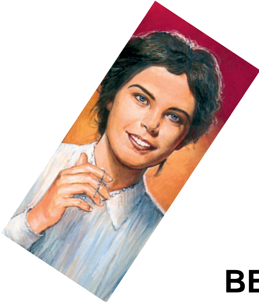
BEATA ALEXANDRINA DA COSTA 1904 - 1955